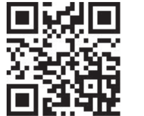
Weitere Pflanzen und Informationen

Wo Sie den Neophytensack kostenlos beziehen und wo Sie ihn entsorgen können, entnehmen Sie bitte dem Abfallkalender Ihrer Gemeinde. Grössere Mengen an Ast- und Wurzelmaterial können direkt bei der KVA Thurgau oder beim ZAB angeliefert werden.