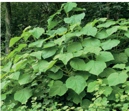
Blauglockenbaum Paulownia tomentosa Wurzeln, Blüten und Samen