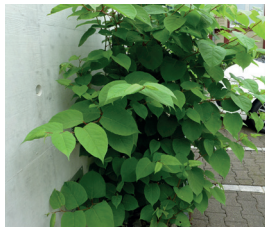
Staudenknöteriche Reynoutria spp. Alles Pflanzenmaterial aus dem Boden