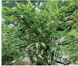
Japanischer Bambus Pseudosasa japonica Wurzeln, Blüten und Samen