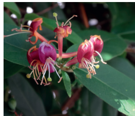
Asiatische Geissblätter Lonicera henryi, L. japonica Ganze Pflanze