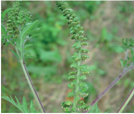
Ambrosia Ambrosia artemisiifolia Ganze Pflanze