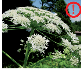
Riesenhärenklau Heracleum mantegazzianum Wurzeln, Blüten und Samen