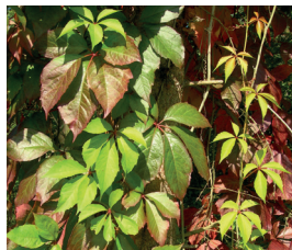
Jungfernrebe Parthenocissus agg. P. inserta/P. quinquefolia Ganze Pflanze