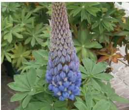
Vielblättrige Lupine Lupinus polyphyllus Ganze Pflanze