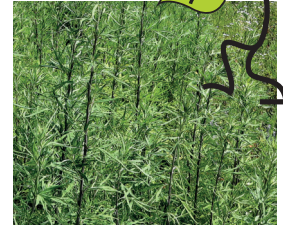
Verlotscher Beifuss Artemisia verlotiorum Ganze Pflanze