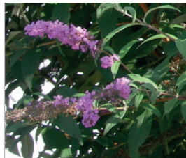
Sommerflieger Buddleja davidii Blüten und Samen