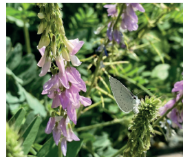
Geissraute Galega officinalis Hülsenfrüchte