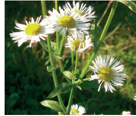
Einjähriges Berufkraut Erigeron annuus Ganze Pflanze