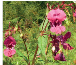
Drüsiges Springkraut Impatiens glandulifera Ganze Pflanze