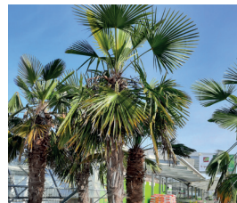
Hanfpalme Trachycarpus fortunei Blüten und Früchte