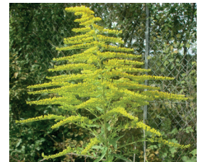
Amerik. Goldruten Solidago canadensis, S. gigantea Ganze Pflanze