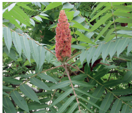
Essigbaum Rhus typhina Wurzeln, Blüten und Samen