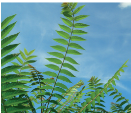
Götterbaum Ailanthus altissima Wurzeln, Blüten und Samen