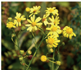
Schmalbl. Greiskraut Senecio inaequidens Ganze Pflanze